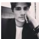
Orinaldo Gjergji (/Post-autori/(objid)/140352/(nodeid)/192684/(author)/Orinaldo Gjergji)