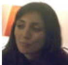
Valentina Vivona (/Post-autori/(objid)/133165/(nodeid)/181048/(author)/Valentina Vivona)